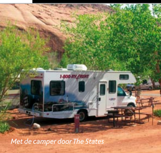
Met de camper door The States